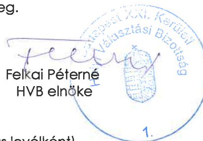
Felkai Péterné HVB elnöke