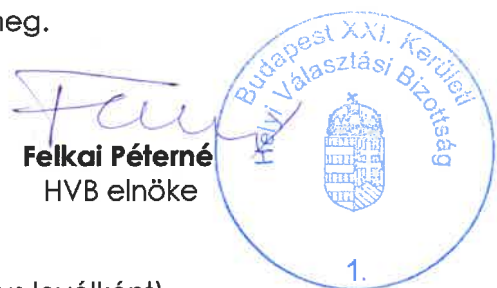
Felkai Péterné HVB elnöke