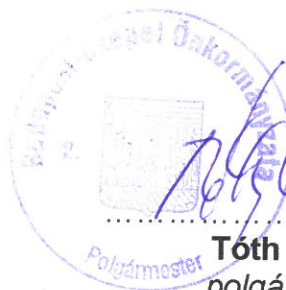
Tóth Mihály polgármester Budapest-Csepel