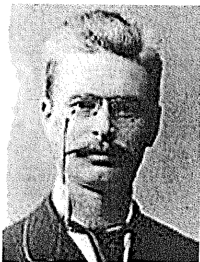
Kvassay Jenő 1850-1919