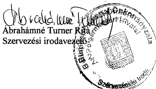
Abrahamné Turner Rita Szervezési irodavezető